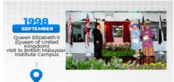
1998 年英国女王访问吉隆坡大学