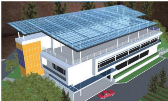
马来西亚第一所高校在建的智能化教学楼