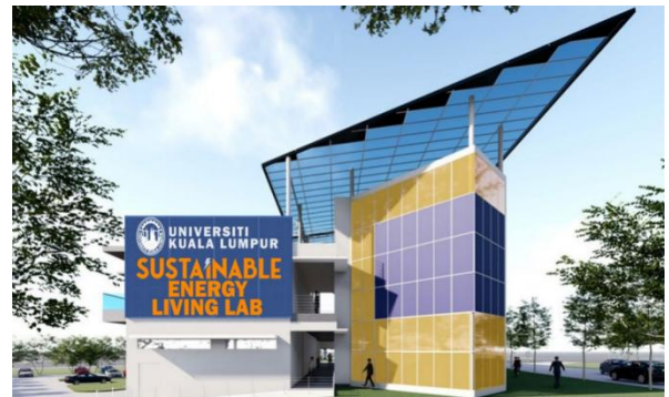
1 st Malaysian ZEB+ Building

Total PV Area: 1,100m 2 PV System Capacity: 182 kWp (553 Modules)