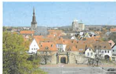
奥斯纳布吕克老城区一隅