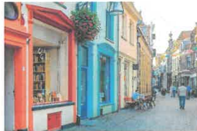
荷兰祖特芬老城区街景