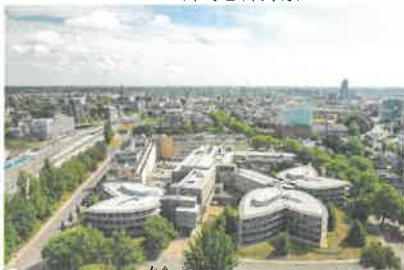
荷兰萨克森应用科学大学及代芬特市区鸟瞰图