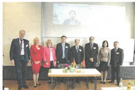
第 16 届研讨会: 前全国政协副主席、中国科学技术协会主席万钢教授 (右) 和中国教育部副部长陈杰 (左) 在签约仪式后在线合影留念