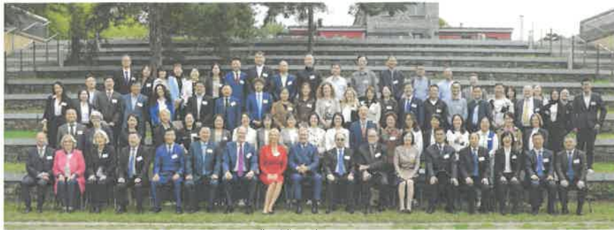
第 16 届研讨会合照